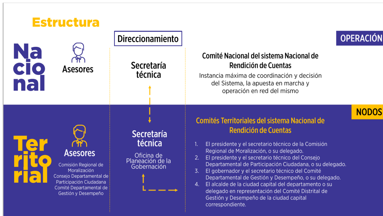
Gráfica 1. Estructura del Sistema Nacional de Rendición de Cuentas

De esta forma y en concordancia con el artículo decimo del mencionado decreto, el Comité Territorial se encuentra conformado por: